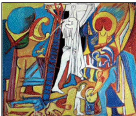
Picasso (1881 - 1973)