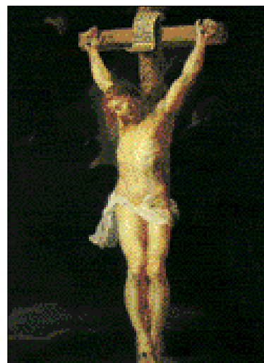
Rubens (1577 - 1640)