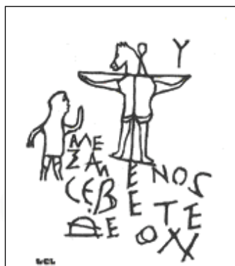
Graffiti d'Alexandrie (IIIème siècle) Première représentation connue d'une crucifixion