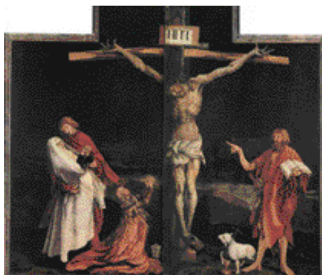
Mathis von Aschaffenburg, dit «Grünewald» (1475-1529)

Cette proposition sera complétée par une approche des sources scripturaires (textes canoniques et apocryphes) associée à l'étude des personnages historiques et à travers les analyses des historiens contemporains.